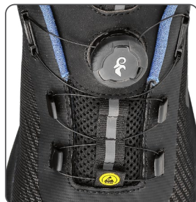
speciální utahovací systém špeciálny systém uťahovania special fastening system specjalny system zapinania