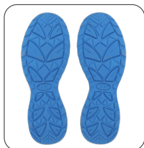
podešev podošva outsole podeszwa