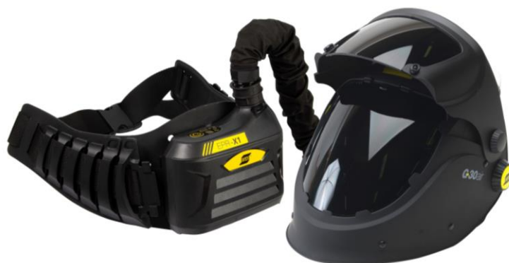
G30 Air s jednotkou ESAB PAPR